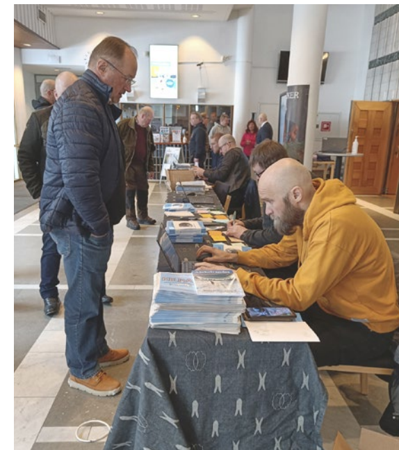
Valtakirjojen tarkastus sujui jouhevasti eikä ruuhkia päässyt syntyämään.