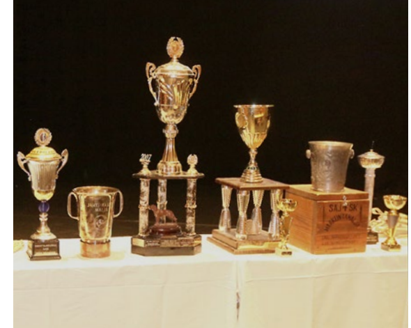
Kokouksessa jaetaan mm. vuosittaiset kiertopalkinnot.