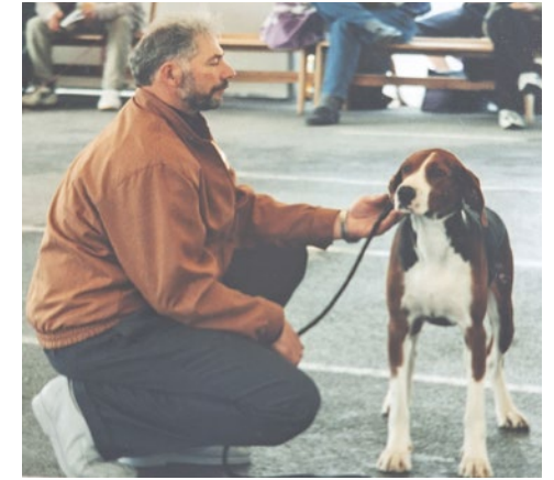
X Arpan Nelli.

x Arpan Nelli, jolla ei ollut pentuja. Seuraavaksi xxx Arpan Noora - xxx Pokon Mika, josta syntyivät xxx Arpan Riemu ja xxx Arpan Riitu. Yhdistelmästä xx Arpan Tella - Pikipuron Rokki syntyi Arpan Hila, joka menehtyi jäätyään junan alle neljävuotiaana. Hila - xxx Riki pentueesta oli xx Arpan Karri. Sitten oli pentue xxx Arpan Riemu - Mannikarin Lojo, josta syntyi xx Arpan Tuisku.