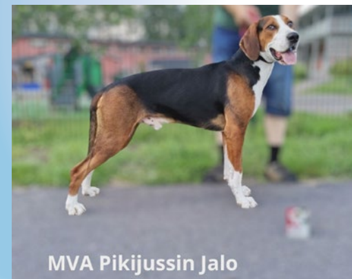
MVA Pikijussin Jalo