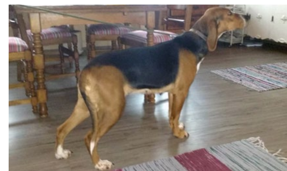
KVA Puskajussin Miralla on 65 jälkeläistä.