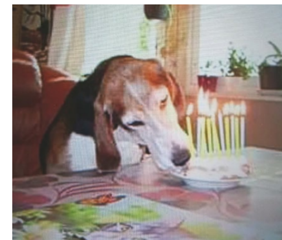
Kaksoisvalio Puskajussin Keno.

Myös tuomarikoulutusta tulee sujuvoittaa. Omassa kenneliipiirissä on ollut kitkaa koulutuk-