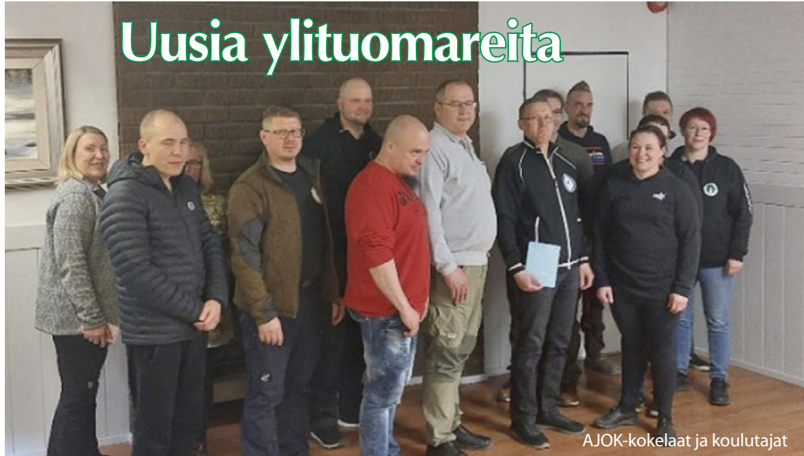
AJOK-kokelaat ja kouluttajat