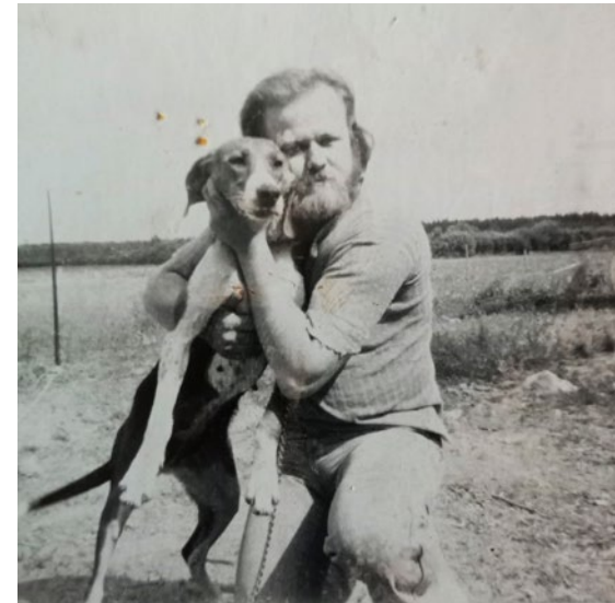
Pauli ja SF05269L/74 Viesti.

Kasvatustyön Pauli aloitti vuonna 1974 yhdistelmällä SF071689/72 FIN MVA Ajo - SF05269L/74 Viesti. Pentueesta Pauli jätti itselleen uros SF12123B/76 Ajoihmeen. Yhdistelmästä SF12123B/76 Ajoihme - SF02822N/74 Jaana syntyi vuonna 1979 seitsemän pentua, joista Pauli jätti it-