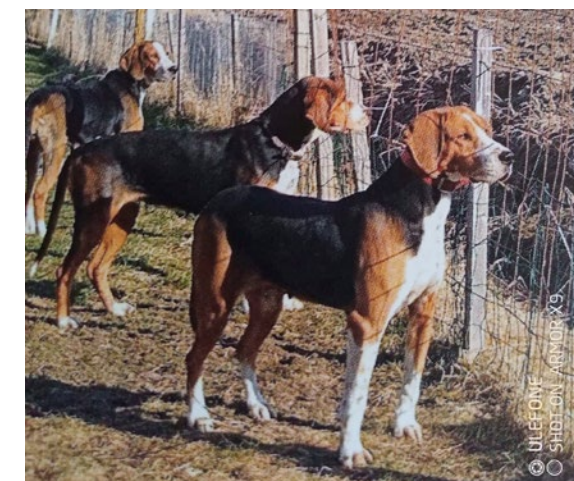
KVA Puskajussin Tella, KVA Puskajussin Didi ja KVA Puskajussin Hilla.