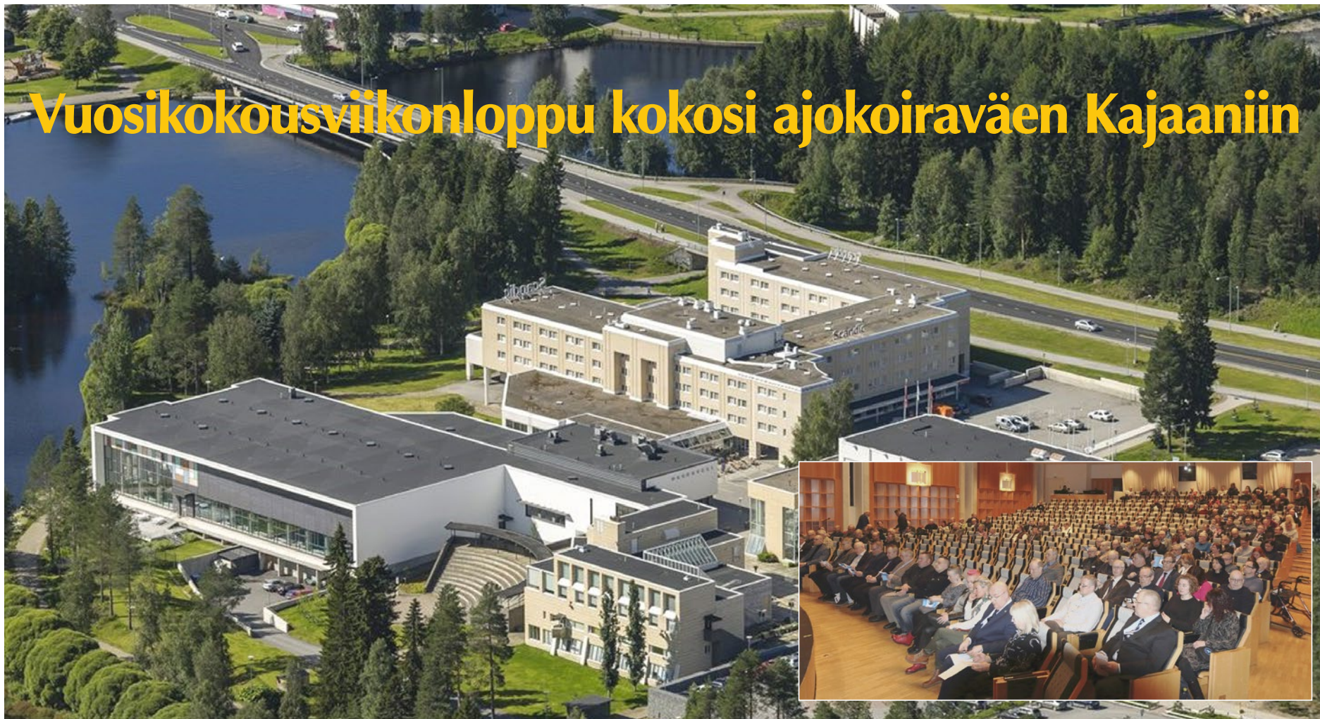
Vuosikokouksen estradina toimi kongressi- ja kulttuurikeskus Kaukametsä, joka yhdistyi käytävällä hotelli Kajanukseen.

Kainuun Ajokoirakerho ja Kainuun jänspiiskat isännöivät kuluvan vuoden Suomen Ajokoirajärjestön päätapahtumia. Ensimmäisenä oli vuorossa vuosikokous- ja päänäyttelyviikonloppu 23.-24.3.2024 Kajaanissa. Ajokoiraväen majoituksesta ja muonituksesta vastasi hotelli Kajanus, jonka vieressä sijaitsevassa Kongressi- ja kulttuurikeskus Kaukametsässä puolestaan päätettiin järjestön vuosikokousasiat. Kaikesta huomasi, että tälläkin kertaa järjestelyistä vastasi kokenut organisaatio eikä soraääniä toimintojen sujumisesta kuultu koko viikonlopun aikana.