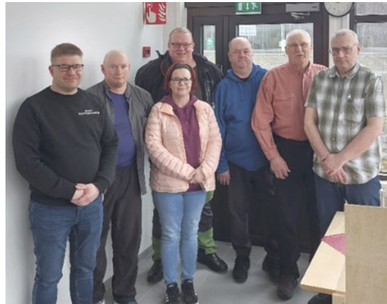
Kettukokelaat ja kouluttaja.