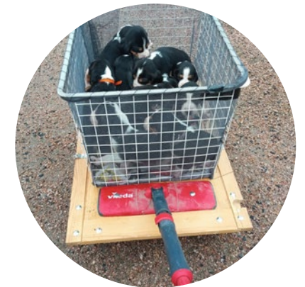
Puskajussin Eetu - KVA Puskajussin Tella jälkeläiset pentuvaunussa matkalla pihamaalle.