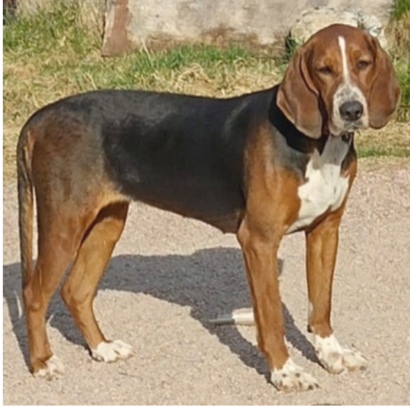
”Ykköstykki” Puskajussin Mokka 2 v.