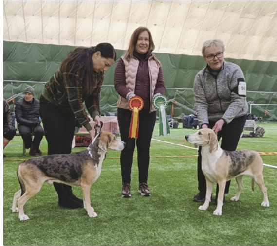
Dunkerinajokoirien ROP Dogiwogin Thor Son Of Odin ja VSP Dogiwogin Draupnir om. Kimmo Souranto.