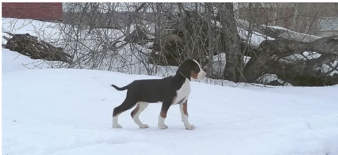
Kuva Heini Rytty