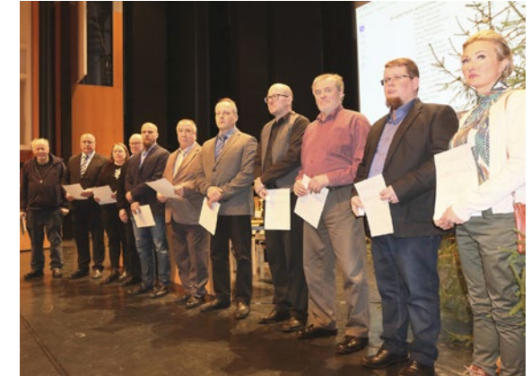
Hopeisen ansiomerkin sai 18 ansioitunutta henkilöä.